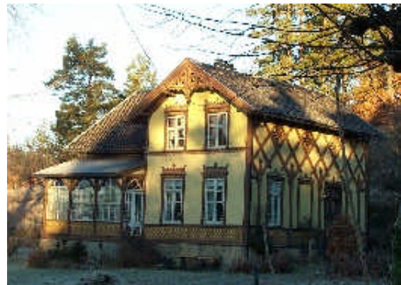
Frednes en vakker vinterformiddag

Utfordringer: Frednes er uregulert. Nye bygninger på eiendommen bør underordne seg den vakre hovedbygningen og falle nøytralt inn i tunet.